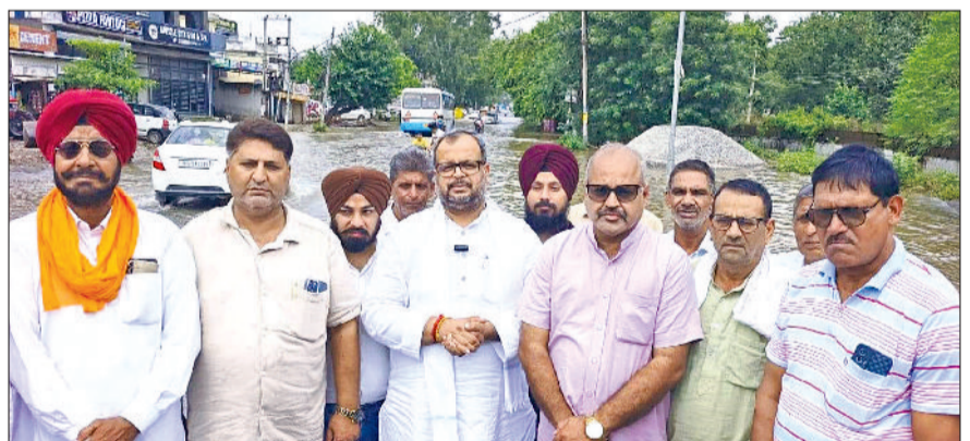
बराड़ा। जलभराव के दौरान लोगों के साथ मौजूद सांसद वरुण चौधरी।

बरसात की वजह से हुए जलभराव का सांसद वरुण चौधरी ने शुक्रवार को क्षेत्र का दौरा किया। स्थानीय लोगों से मुलाकात कर उनकी समस्याओं को सुना। दोपहर के समय सांसद बस स्टैंड के पास बने 'महाराजा रणजीत सिंह चौक' पहुंचे। यहां बारिश का पानी भर जाने से आमजन को भारी मुश्किलों का सामना करना पड़ रहा था। उन्होंने कहा कि कस्बे की भौगोलिक स्थिति ऐसी है कि बरसात के दिनों में यहां पहाड़ी क्षेत्रों से पानी आता है। यह पानी नालों और पुलियों के जरिए बहकर निकलता है। लेकिन समय