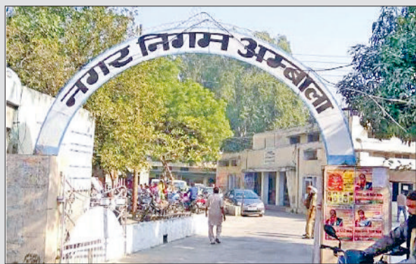
अंबाला। नगर निगम ऑफिस का बाहरी दृश्य।

द्वारा ताजा परिसीम अर्थात् सभी 20 वार्डों की नए सिरे से वाइबंदी की जाएगी। उसके बाद निर्वाचन आयोग द्वारा मतदाता सूचियों को अपडेट करने की प्रक्रिया आरंभ की जाएगी जिसमें एक से दो महीने का समय लगेगा। यह प्रक्रिया संपन्न होने के बाद शहरी निकाय विभाग द्वारा नए सिरे निर्धारित किया जाएगा कि 20 वार्डों में से कौन कौन सा वार्ड किस वर्ग के लिए आरक्षित होगा। यह भी तय होगा कि मेयर का पद भी किस वर्ग के लिए आरक्षित होगा अथवा अनारक्षित होगा। उसके बाद निर्वाचन आयोग आम चुनाव की घोषणा होगी। 2018 से प्रदेश में नगर निगम मेयर का प्रत्यक्ष चुनाव होता है।