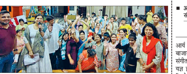
पानीपत। श्री दिगंबर जैन बड़ा मंदिर, जैन मोहल्ला में भजन गाते हुए श्रद्धालुगण।

■ जैन मंदिरों में दसलक्षण पर्व का नौवां दिवस उत्तम आकिचन धर्म के रूप में मनाया