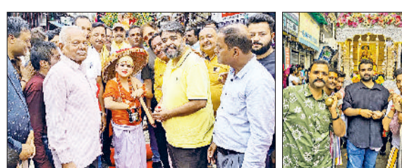
अंबाला। भगवान वामन का रूप धारण करने वाले कलाकार से आशीर्वाद लेते पूर्व मंत्री व हिंडोले को ले जाते श्रद्धालु।